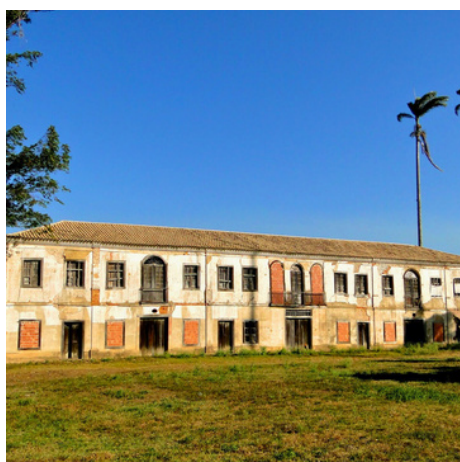
Solar dos Airizes.