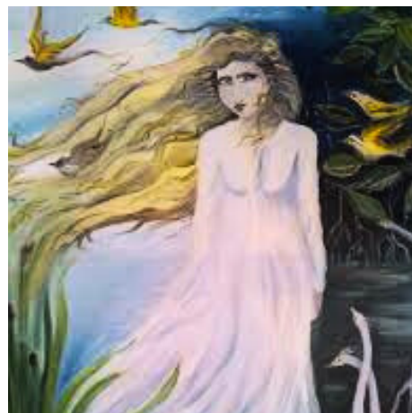
Moça Bonita.