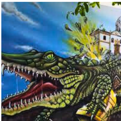
Ururau da Lapa. fonte: BlogSpot - 2011