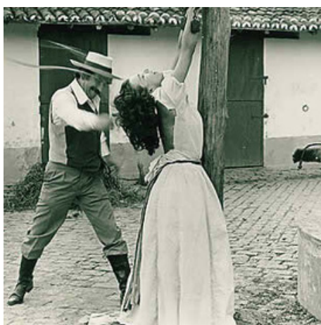
Escrava Isaura.