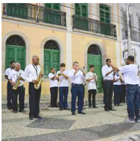
Lira Conspiradora.