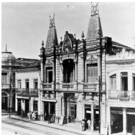
Lyra de Apolo.