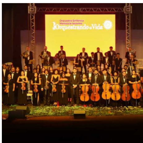
Orquestrando a Vida.