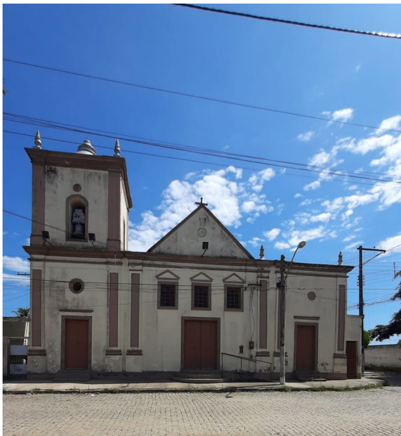
Fachada da igreja