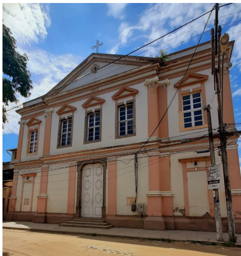
Fachada da igreja