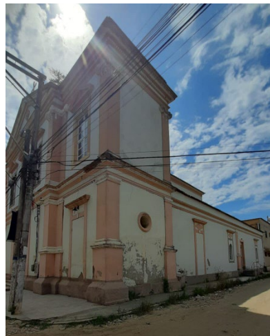
Fachada lateral da igreja