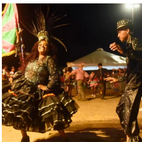
Desfile 2023.