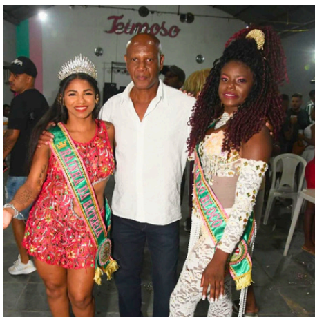
Presidente, Rainhas do Bloco e da Bateria.