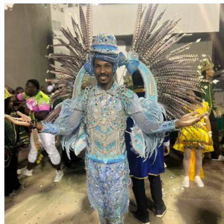
Rei da Bateria.