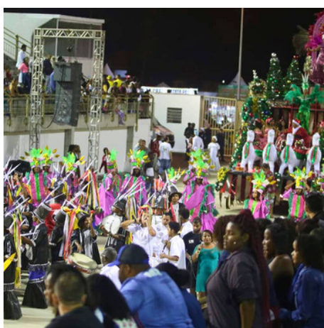
Desfile 2019.