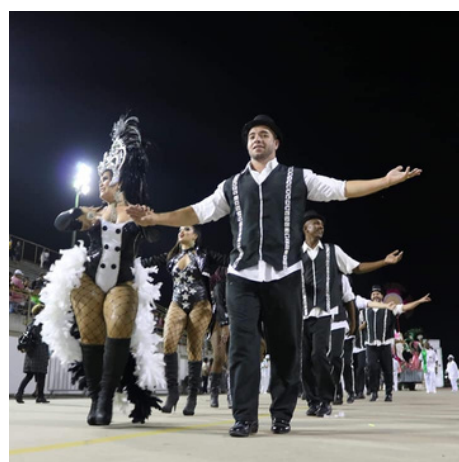
Desfile 2019.

O que é: o Bloco de Samba Teimoso do IPS é uma agremiação cultural de Campos dos Goytacazes, que faz parte do cenário carnavalesco da cidade. Seu foco está na valorização do samba e das tradições carnavalescas, com apresentações que mesclam ritmos, enredos e fantasias. Diferentemente de escolas de samba, blocos têm maior liberdade criativa, não se prendendo a algumas exigências típicas do carnaval competitivo.