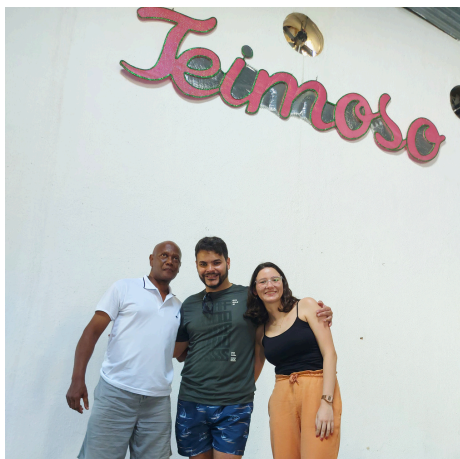
Presidente e Carnavalesco do Bloco. Fonte: Foto Pessoal - 2024