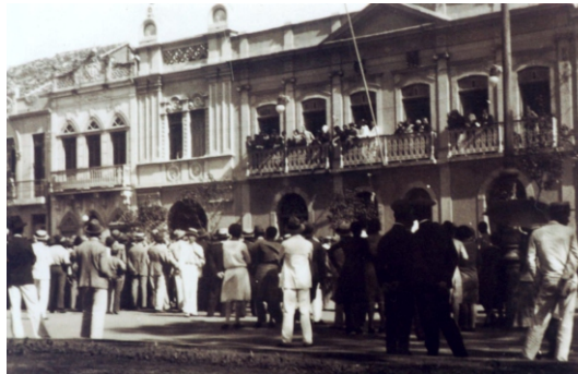
Foto 1: Praça São Salvador, s.a. Data aprox.: década de 1920.